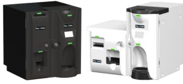
Pay Cube(硬貨投入口付) 「キュービック」または「L型」の2タイプ・ 「黒」「白」の2色から選択