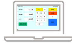
簡易自動精算システム