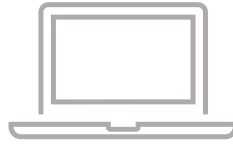
パソコン (簡易自動精算システム インストール済)